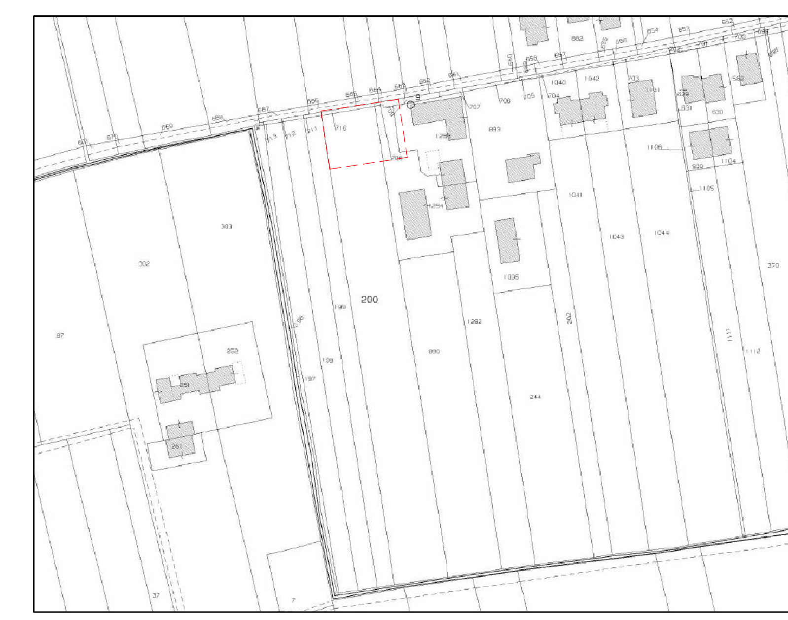
ESTRATTO di MAPPA CATASTALE COMUNE DI CITTADELLA-SEZ.U-FG.12°-MAPP.200, 710, 708, 1293, 1294